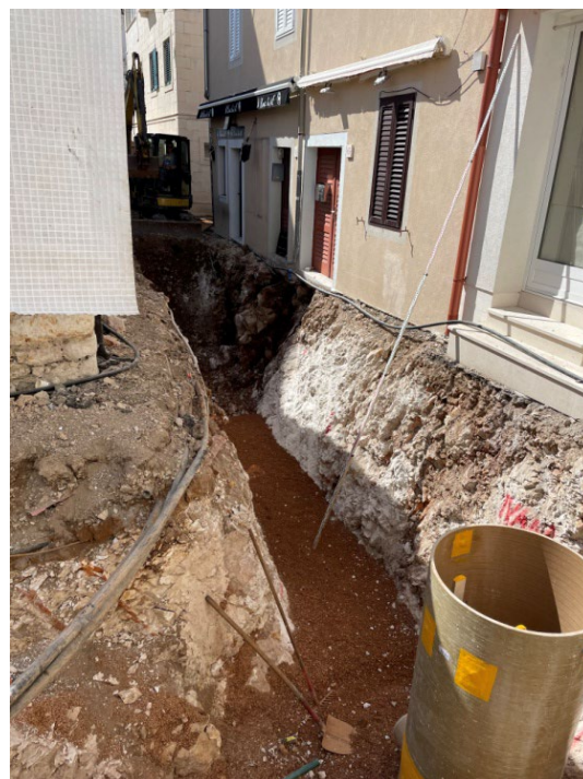
Slika 1 GRP kanalizacijsko okno