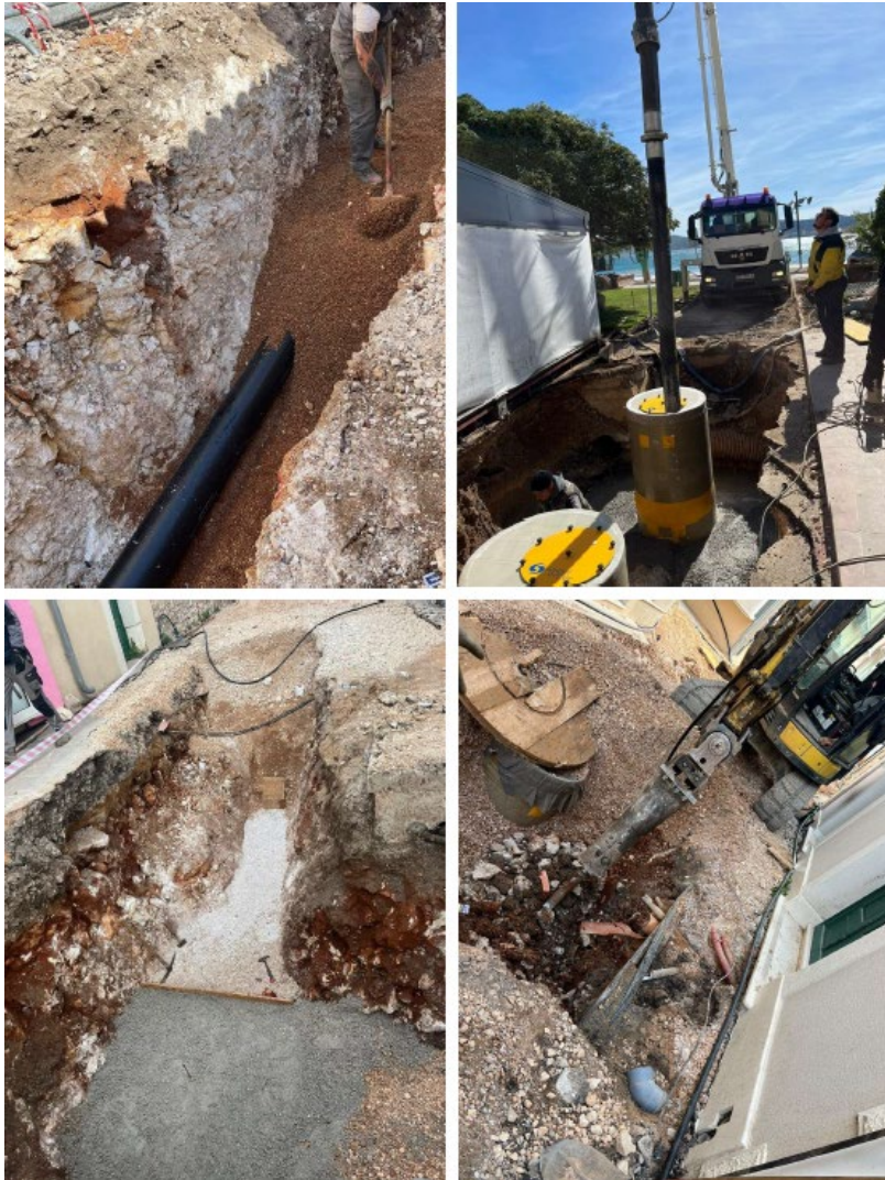
Slika 3 Radovi na ugradnji cijevi