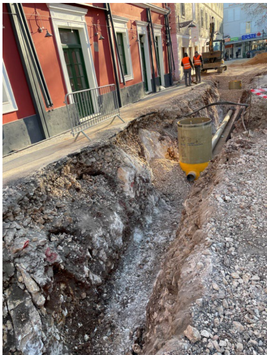
Slika 2 Montažni radovi u Ulici kralja Tvrtka